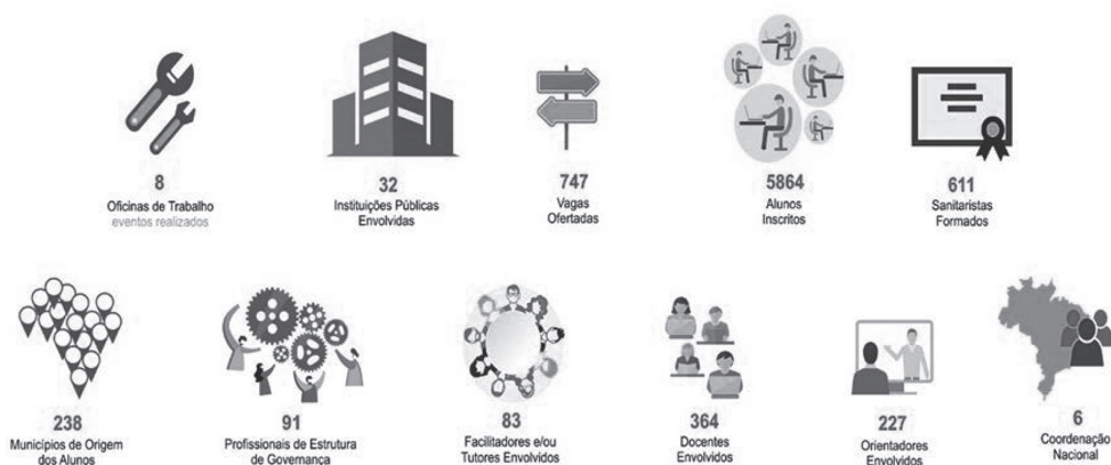
Figura 2. A nova formação em Saúde Pública em números